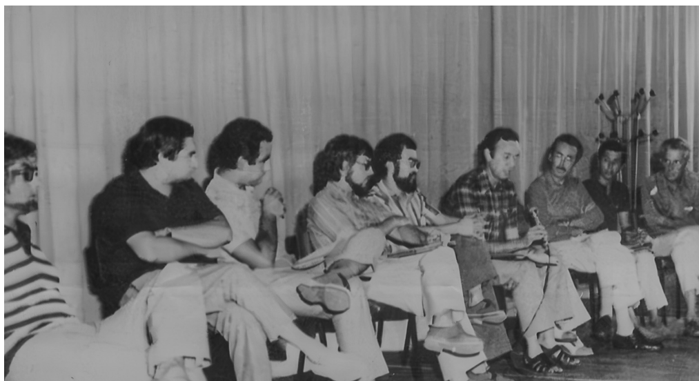
Presentació del Manifest de Prada a l'UCE del 1973