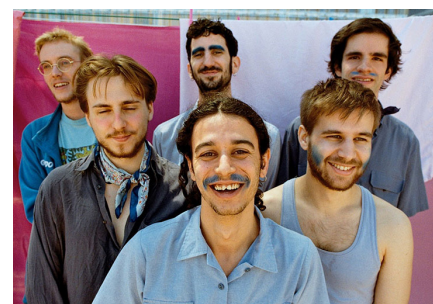
La Ludwig Band

Diuen que són el segon grup més important d'Espolla, una petita població de l'Alt Empordà. L'afirmació ja ens deixa clar el caràcter irònic de la banda, a qui no agraden les coses excessivament previsibles. Aquesta nit ompliran de versos heptasil·lars la plaça de Prada en un dels poquíssims concerts que el grup ha fet aquest estiu mentre ultimen el seu nou disc Gràcies per venir .