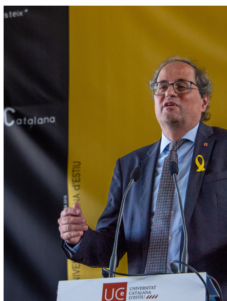
Els presidents José Montilla (2002) i Quim Torra (2018)